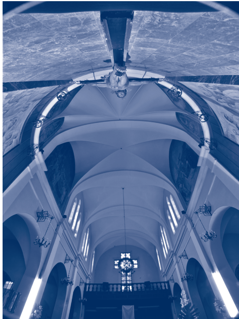
PRIMER PREMI: "L'ull que tot ho veu" de MARTÍN PALATSI SENAR