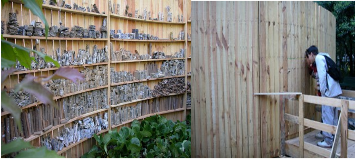
Biblioteca de cuerdas y nudos. Viseu 2003 Instalación. Parque Viseu 2003