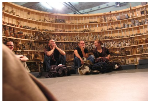
Biblioteca de conocimientos narrados Anvers (Bélgica) 2005

Los sábados indicados se ofrecerán visitas guiadas para el público familiar.