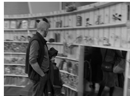
Biblioteca de cuerdas y nudos. Anvers 2004