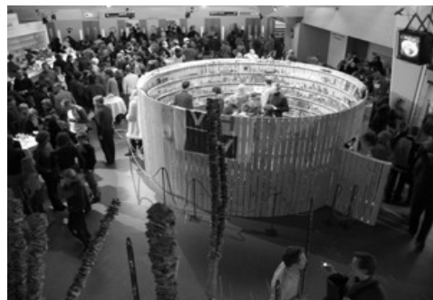
Biblioteca de cuerdas y nudos Anvers (Bélgica) 2005