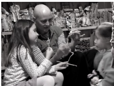
Funciones en Anvers (Bélgica)