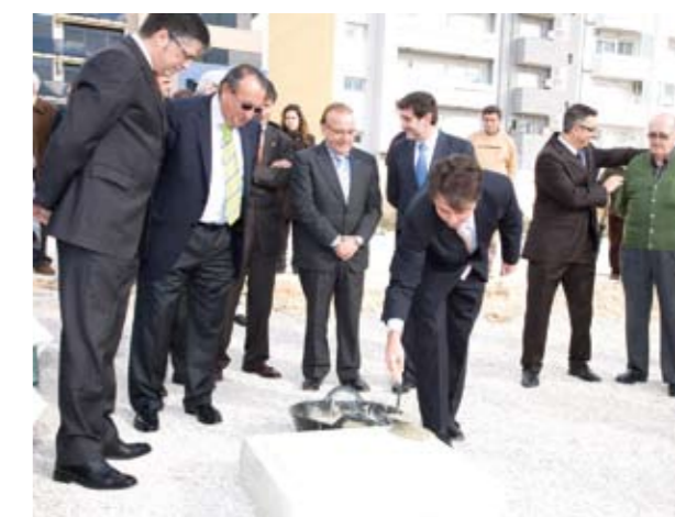
Des que es va posar la primera pedra, a finals de novembre, les obres no s'han aturat

Paral·lelament, el projecte modificat també inclou l'espai per a ubicar una nova consulta de pediatria i una altra de medicina general, amb les corresponents sales d'infermeria. Per últim, s'ha previst el creixement en alçada del Centre de Salut, en cas que en un futur s'hagueren d'afegir més plantes a les tres que es construiran ara. Per a incorporar totes aquestes novetats s'ocuparan 300 metres quadrats més de superfície, que s'afegiran als 2.000 que ja estaven previstos i que suposaran en total més de 7.000 metres quadrats construïts.