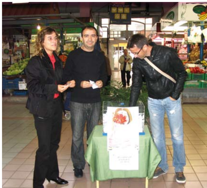
La campanya de l'any passat va ser tot un èxit

Durant tots els dies que dure la campanya, s'instal·larà una car-