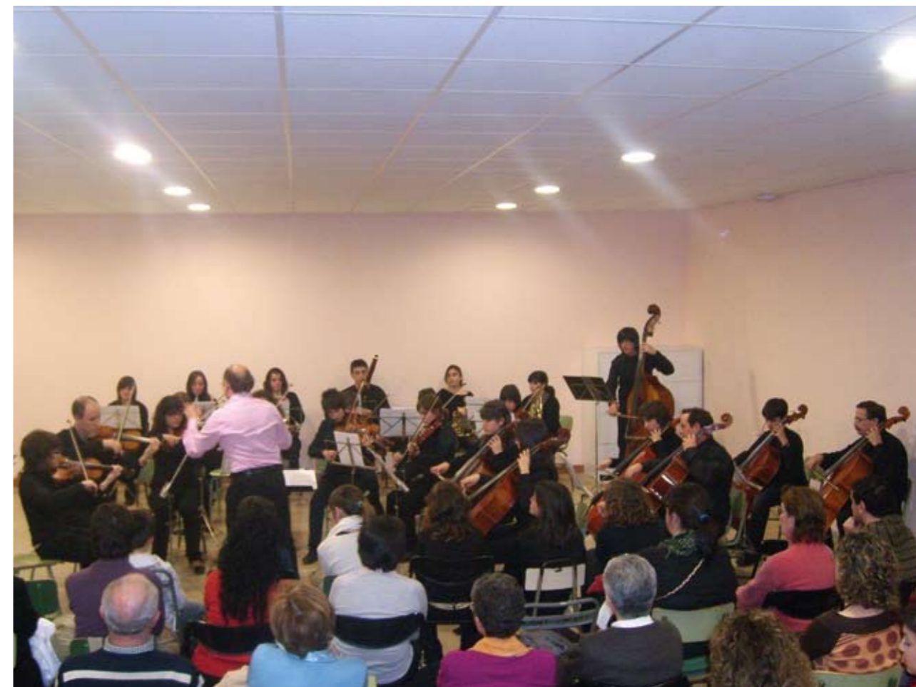
Els alumnes del Conservatori participen activament de la Setmana Cultural

Del 4 al 8 d'abril tindrà lloc la tercera edició de la Setmana Cultural que organitza el Conservatori Municipal de Música de Benicarló. Els diversos actes ofereixen un ventall molt variat d'activitats dirigides tant als alumnes com als pares i mares com al públic en general.