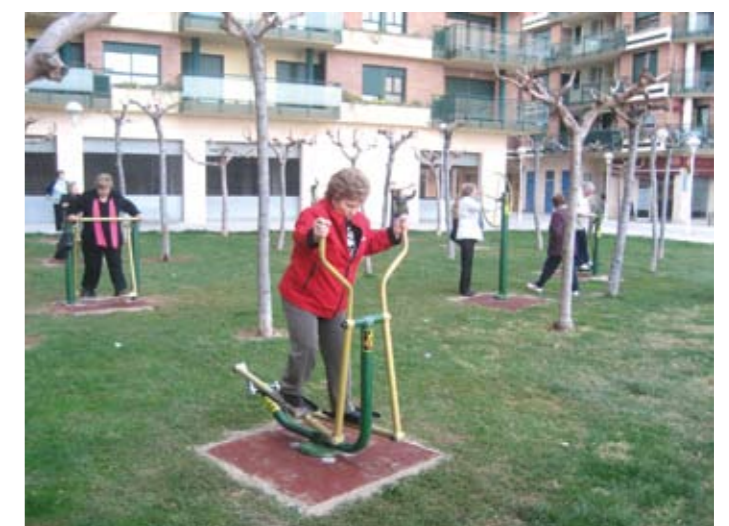
Els més grans ja disfruten de fer esport a l'aire lliure