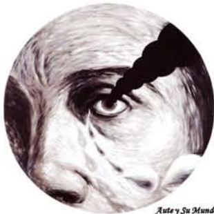
Aute y Su Mundo

Pintor, compositor, poeta, escultor, cineasta... Aute és un artista que escolta amb horror, amb pietat i amb indignació la fragmentació de la Història, i que escolta amb solidaritat les seves pròpies fractures i la fragmentació dolorida dels seus contemporanis. Desesperat i generós, esquerdat i fratern, tentacular i proïsme, Aute és un artista arquetípic de la modernitat compromesa, eixa modernitat que estableix que un creador del nostre temps és un sobreviure estripat.