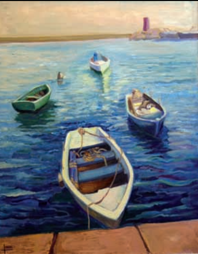
A TEMPO | 81x65 | Acrilic sobre llenç | 2008