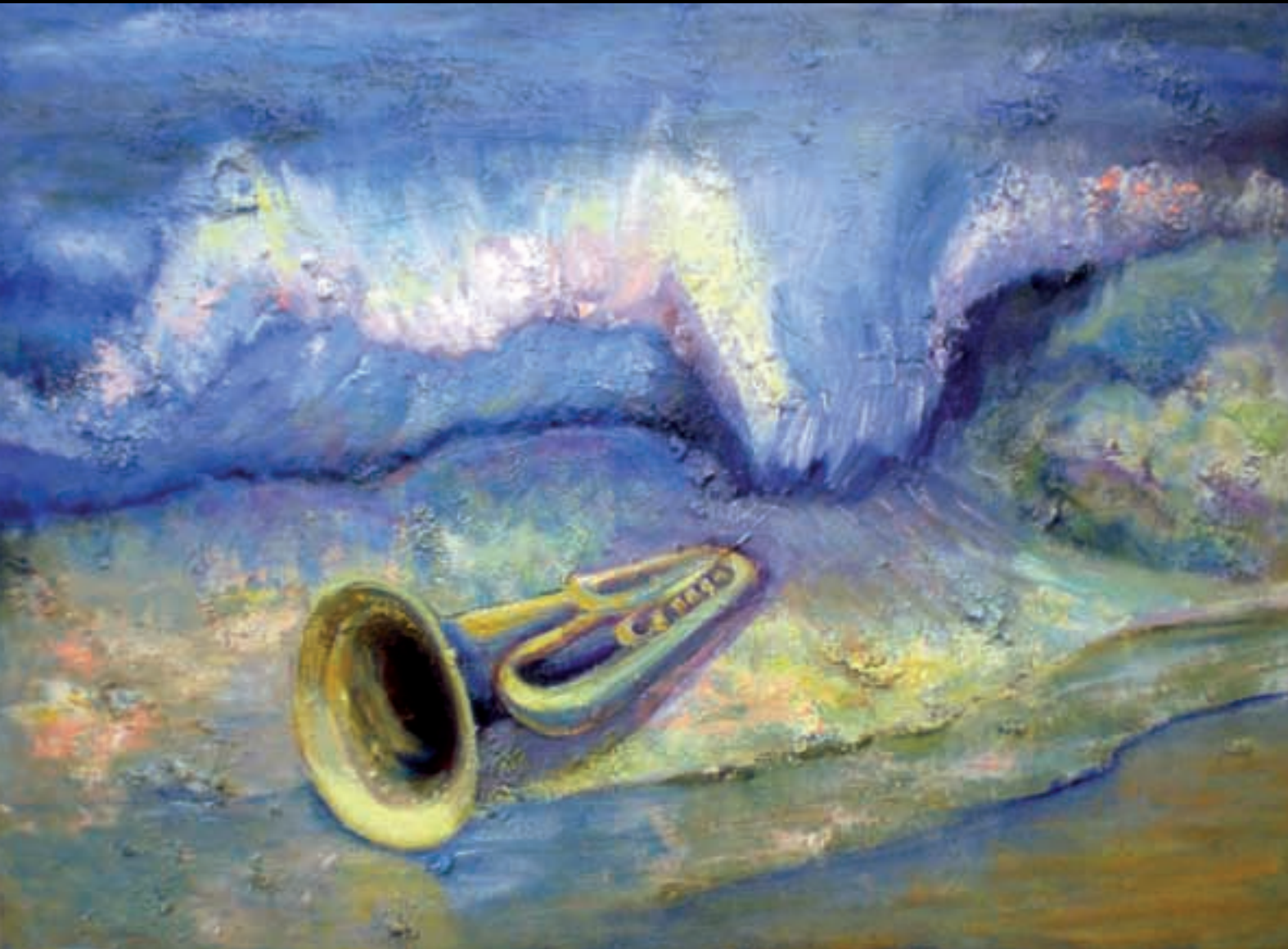
SO DE MAR | 73 x 92 | Acrílic sobre llenç