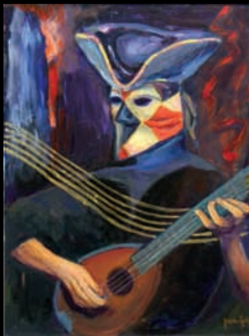
MÁSCARA | 81x60 | Acrílico sobre llenç | 2008