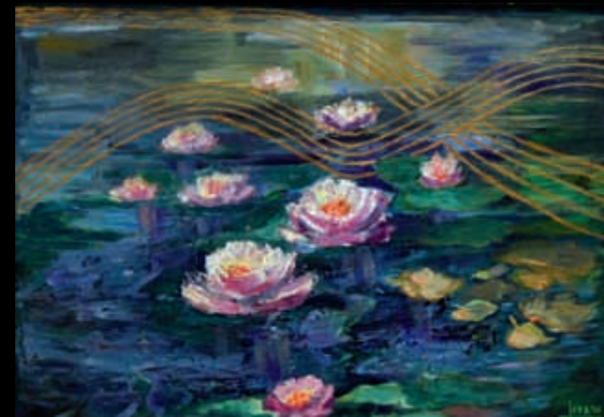
INSPIRACIÓ | 46x65 | Acrílic sobre llenç | 2008