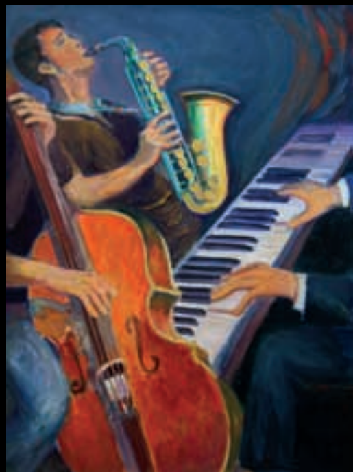
Jam Session | 81x61 | Acrílico sobre llenç | 2008