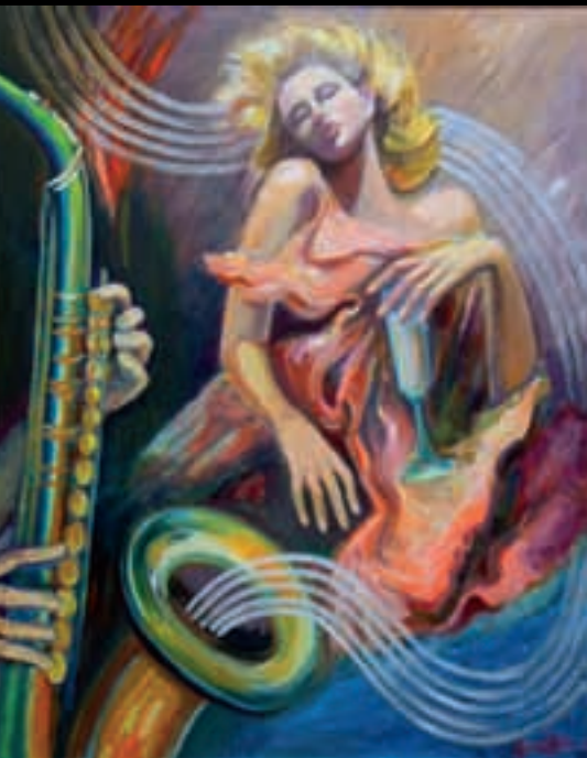
SENSUAL JAZZ | 81x65 | Acrílico sobre llenç | 2008