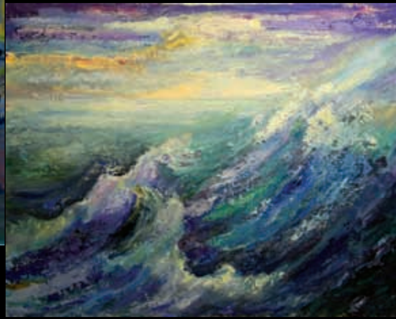
IN CRESCENDO | 73x92 | Acrilic sobre llenç | 2008