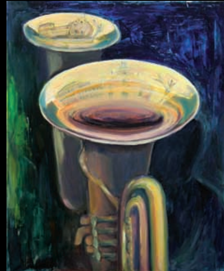
La Festa | 73x60 | Acrílico sobre llenç | 2008