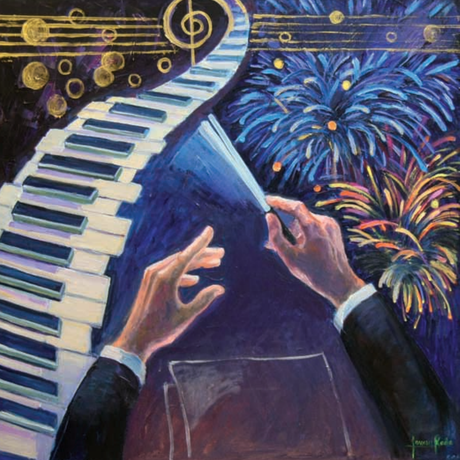
Festes valencianes | 73x73 | Acrílic sobre llenç | 2008