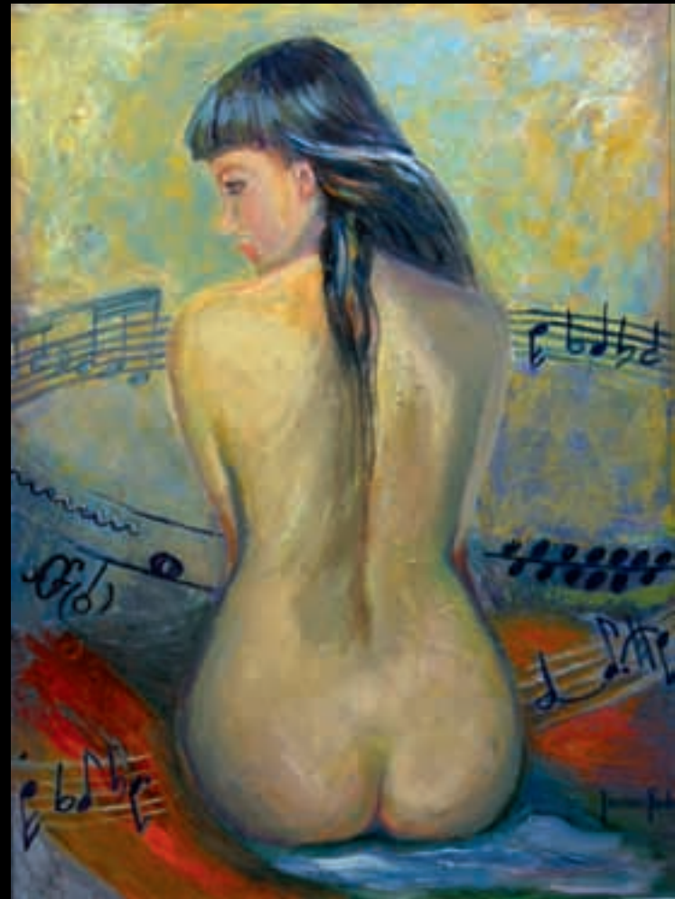
VIOLON-XELO | 81x60 | Acrilic sobre llenç | 2008