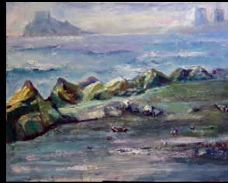
DA CAPO | 65x81 | Acrilic sobre llenç | 2008