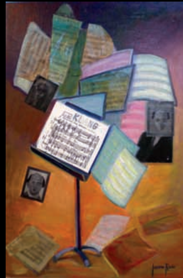
HOMENATGE A SCHÖNBERG | 81x54 | Acrílico sobre llenç | 2008