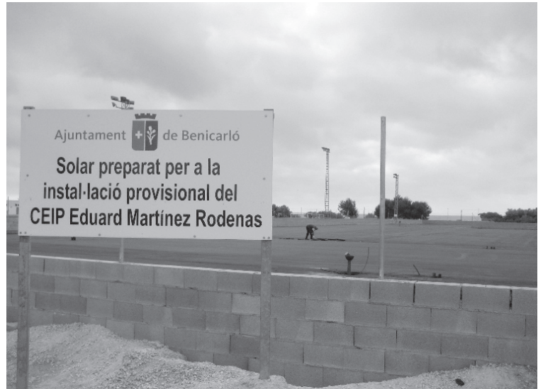
Els terrenys ja s'han asfaltat

El recinte, que quedarà tancat per tal de garantir la seguretat dels escolars, ocuparà una superfície de 5.658 m 2 . Les obres han costat 183.514,23 euros.