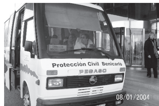
L'autobús de Protecció Civil realitza el trasllat

Aquest servei s'ha posat en marxa mitjançant la col·laboració de les regidories de Governació i Benestar Social i el realitza Protecció Civil de Benicarló, en el marc d'un conveni signat entre aquesta associació i l'Ajuntament. Les persones interessades en fer ús d'aquest servei poden adreçar-se al Centre Social Municipal La Farola.