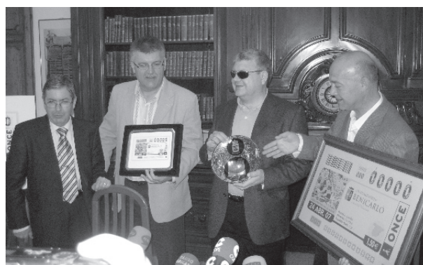
Representants de l'ONCE es van desplaçar a Benicarló

E n el sorteig de l'ONCE del passat 24 d'abril, Benicarló va ser protagonista. I és que l'ONCE va il·lustrar el cupó amb una imatge aèria de la ciutat, amb l'església de Sant Bartomeu en el centre. En total, els 22.000 distribuïdors oficials van vendre cinc milions de cupons a tot Espanya amb la imatge de la ciutat. Benicarló, amb 20 afiliats de l'ONCE, és el municipi amb un dels índexs de venda de cupons més alt de la província. L'Ajuntament de Benicarló va agrair la iniciativa als representants de l'ONCE que es van desplaçar fins a la ciutat i va lloar les tasques d'integració social que realitza l'organització.