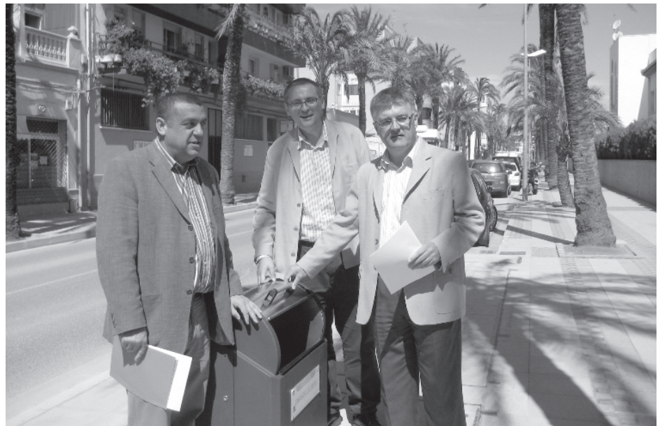
Els nous contenidors ajudaran a mantenir la ciutat més neta