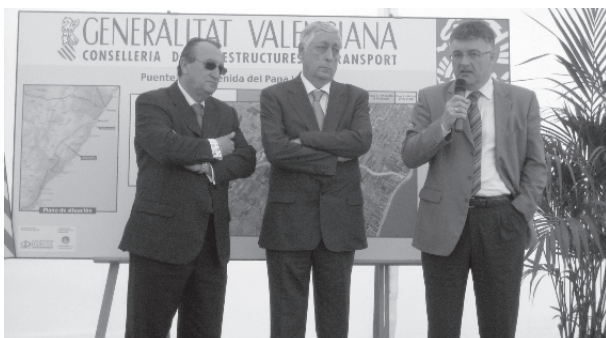
L'alcalde de Benicarló amb el president de la Diputació

capa d'asfalt. Aquestes importants obres de millora del pont i el projecte de canalització de la Rambla, que estarà enllestit el 2010, contribuiran a millorar sensiblement l'entorn del Barranquet i reduiran els problemes de la zona causats per les inundacions i les avingudes d'aigua.