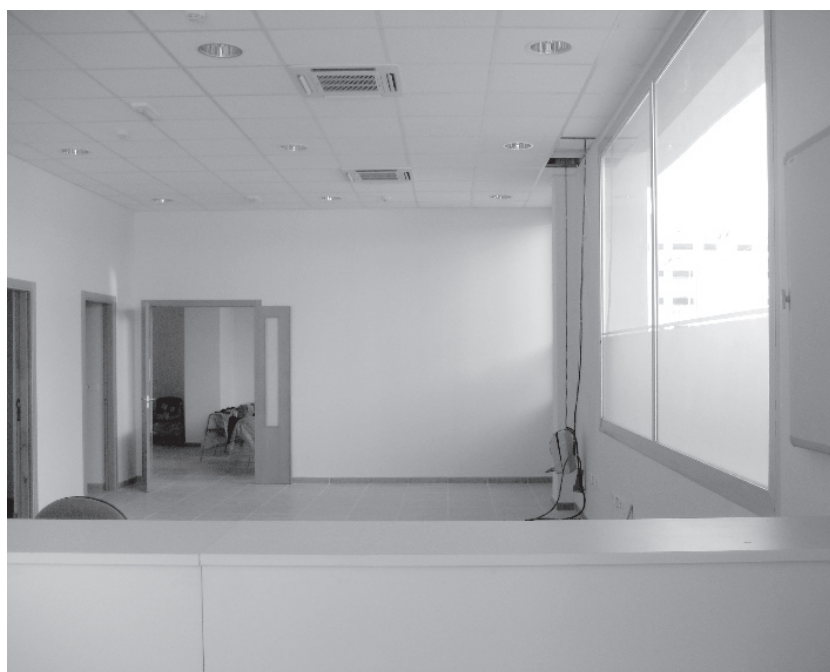
Interior de les noves dependències de la Policia Local

Finalment, l'arxiu també s'ubicarà en aquests locals, entre la Biblioteca i les dependències de la Policia Local.