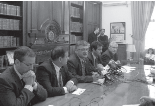
Presentació del projecte a l'Ajuntament

E l Ministeri d'Indústria invertirà 614.000 euros en un projecte per a la incorporació de les noves tecnologi-