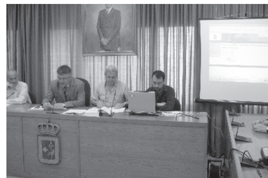
Sorteig de les taules durant el Ple

Enguany, com a novetat, els serveis informàtics de l'Ajuntament han desenvolupat una aplicació informàtica pionera que ha permès designar els membres de les 29 taules electorals i 9 càr-