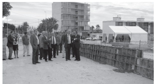
Un moment de la visita d'obres