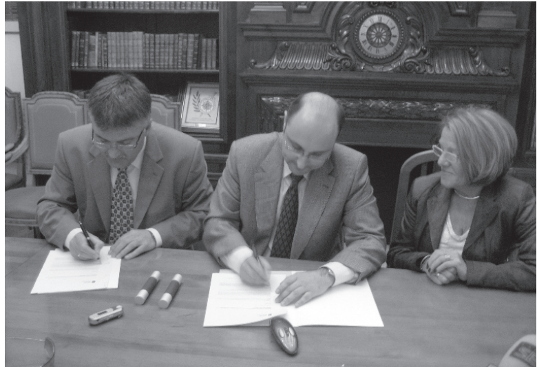
Moment de la firma del conveni amb Mercasa

De moment, Mercasa (empresa pública especialitzada en mercats municipals) farà un avantprojecte tècnic del que podria ser el futur mercat de Benicarló, que es podria allargar sis mesos i després