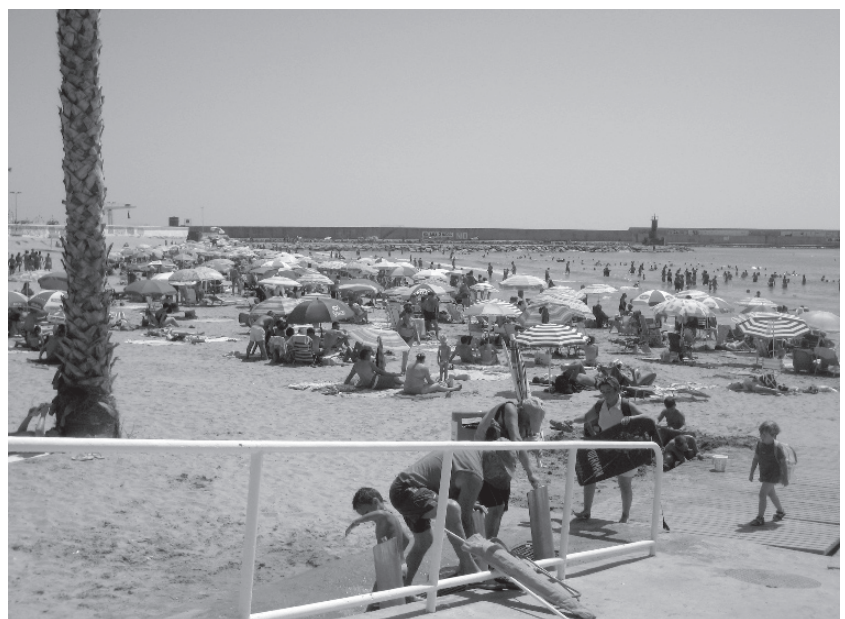
El servei de Creu Roja començarà el 15 de juny

L'objectiu de la Regidoria de Turisme és assegurar l'actuació immediata i la vigilància directa dels usuaris de les platges.