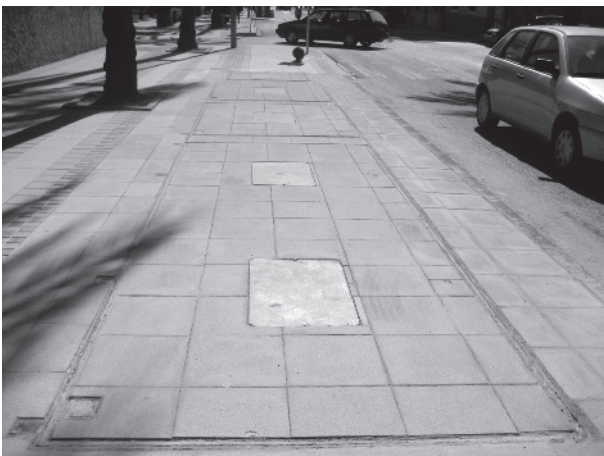
Tot a punt per a instal·lar els contenidors.

El mes passat van començar les obres per a instal·lar els primers contenidors soterrats a Benicarló. La primera illa de contenidors s'ha instal·lat al passeig Marítim i la segona s'ha començat a instal·lar al carrer de Jacinto Benavente. Cadascun d'aquests punts inclou sis contenidors independents, tots amb plataforma hidràulica: tres per a residus orgànics i un per a paper i cartró, un altre per a envasos i un altre per a vidre.