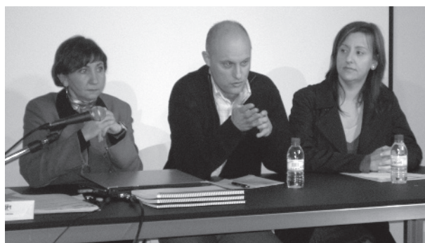
Assistents i organitzadors del curs.

ament civil, la metodologia de les peritacions socials o la intervenció en abusos sexuals a menors. A més, s'han analitzat més de 15 informes socials, psicossocials i psicofamiliars de casos pràctics relacionats amb els menors.