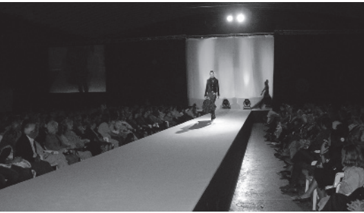
Desfilada de l'any passat.

L'Ajuntament de Benicarló, a través de la Regidoria de Comerç i l'Agència per al Foment d'Iniciatives Comercials (AFIC), organitza, amb la col·laboració de la Unió de Comercios de Benicarló, la cinquena edició de la Desfilada de Moda que tan bona acollida de públic