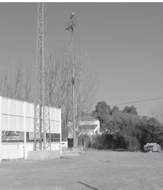
Futura ubicació dels vestidors.

De moment, el solar on s'ha d'ubicar el centre s'utilitzarà com a aparcament per als usuaris de l'actual ambulatori, situat just al darrere.