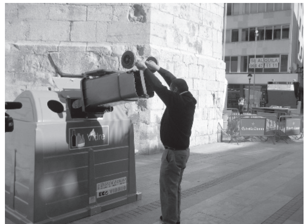
Els contenidors inclouen un sistema novedós.

Benicarló ha estat la primera ciutat de la província de Castelló a instal·lar un novedós servei de recollida de vidre. El nou sistema de reciclat està adreçat sobretot als sectors de la restauració i l'hostaleria i, a més, com a novetat, també s'ha posat a disposició dels casals fallers durant aquestes passades festes. Els establiments que s'han adherit a la iniciativa tenen a la seua disposició un cubell amb rodes per anar dispositant el vidre i després transportar-lo fins als contenidors especials de vidre, que s'han adaptat amb una boca ampla per facilitar el buidatge dels cubells.