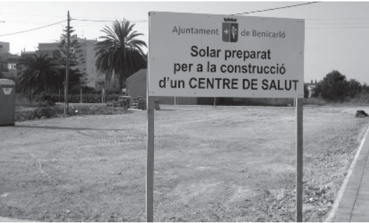
Solar preparat per al nou centre de salut.