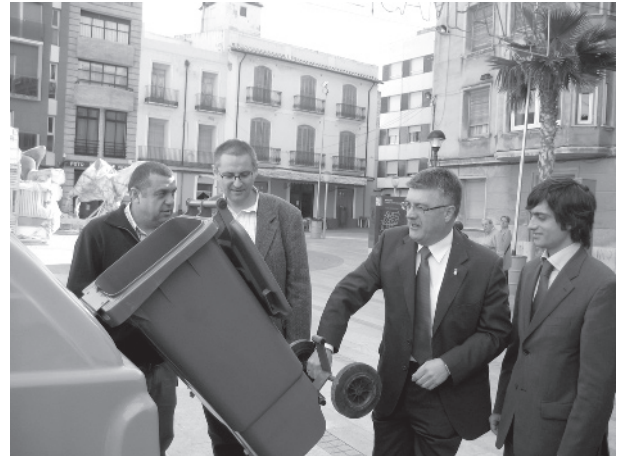
L'equip de govern prova els nous contenidors.