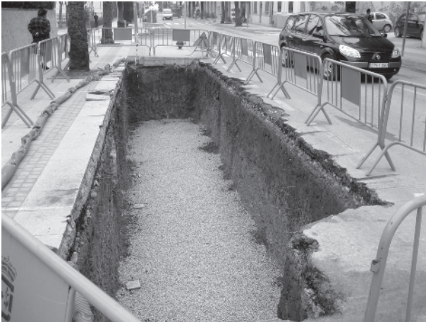
Preparació per a instal·lar els contenidors soterrats.