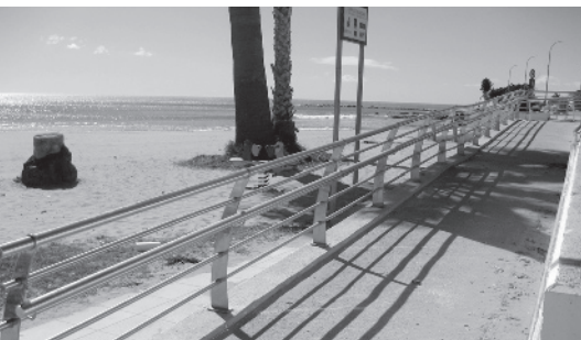
Passarel·les al Morrongo.

La Regidoria de Turisme ha iniciat les tasques de condicionament de les platges de cara a la temporada 2007, que s'iniciarà amb l'arribada de les vacances de Setmana Santa. Per això, s'han instal·lat unes passarel·les de formigó que permeten l'accés a persones amb