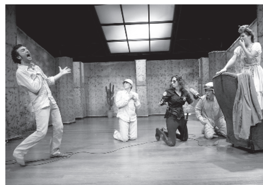
Diferents instantànies de l'obra El cel dins d'una estança de la companyia Bambalina.