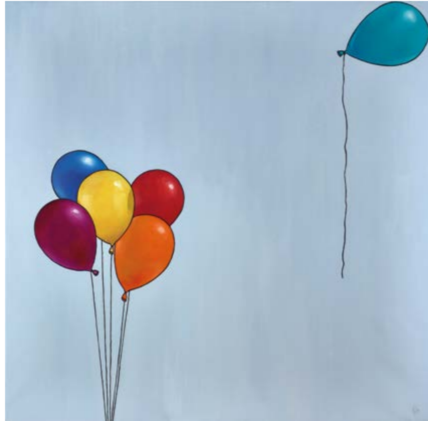
Globus de foc (Oli sobre tela, 150x150 cm.)