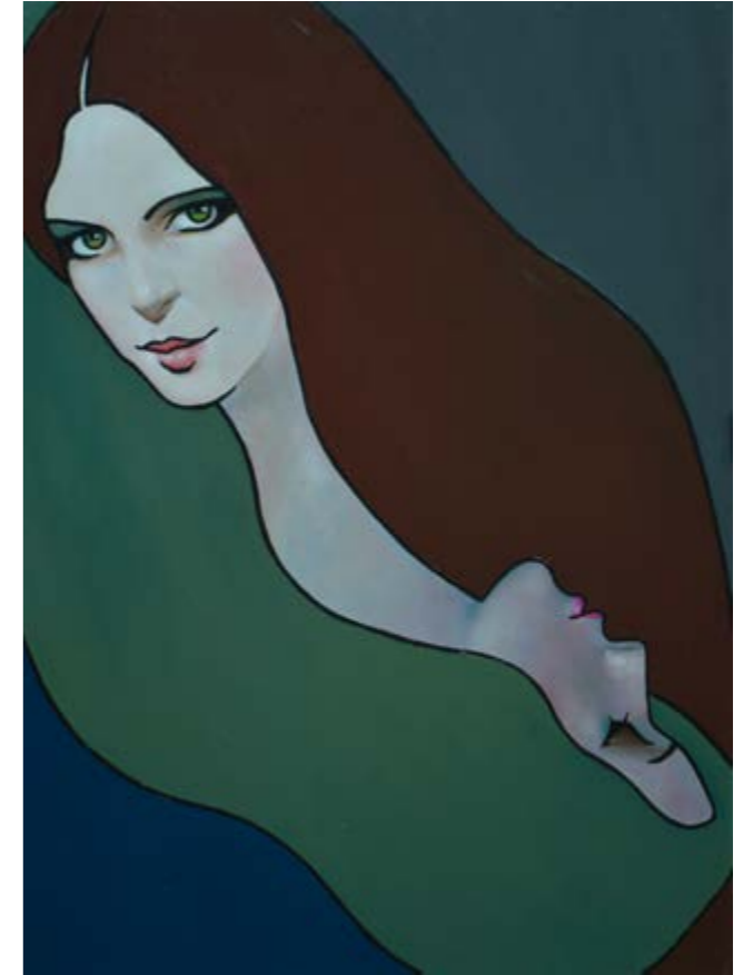
Dualitat (Oli sobre tela, 54x73 cm.)