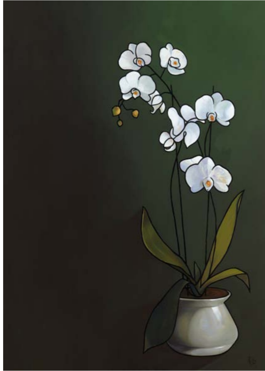
Aixopluc d'urpes humanes (Oli sobre tela, 162x114 cm.)