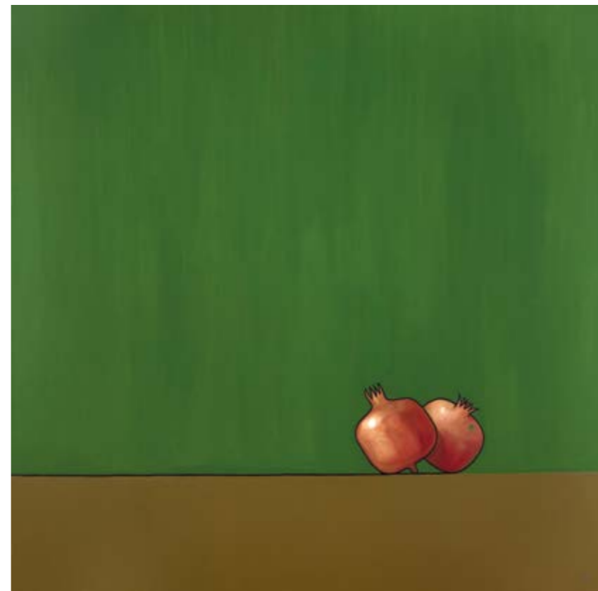
Els teus llavis (Oli sobre tela, 150x150 cm.)

«Això, cap a on anàvem en tot aquell camí, cap a la Naixença o la Mort?»