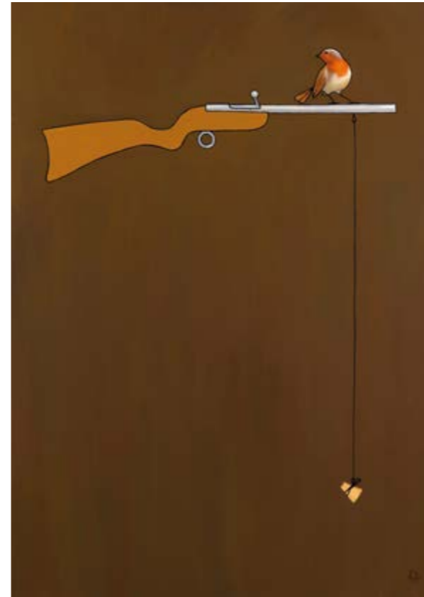
Seguint un estel fugaç (Oli sobre tela, 162x114 cm.)

No importa com siga d'estreta la reixa, com de càstigs feixuc el pergamí: soc mestre del meu destí, soc el capità de l'anima meua.