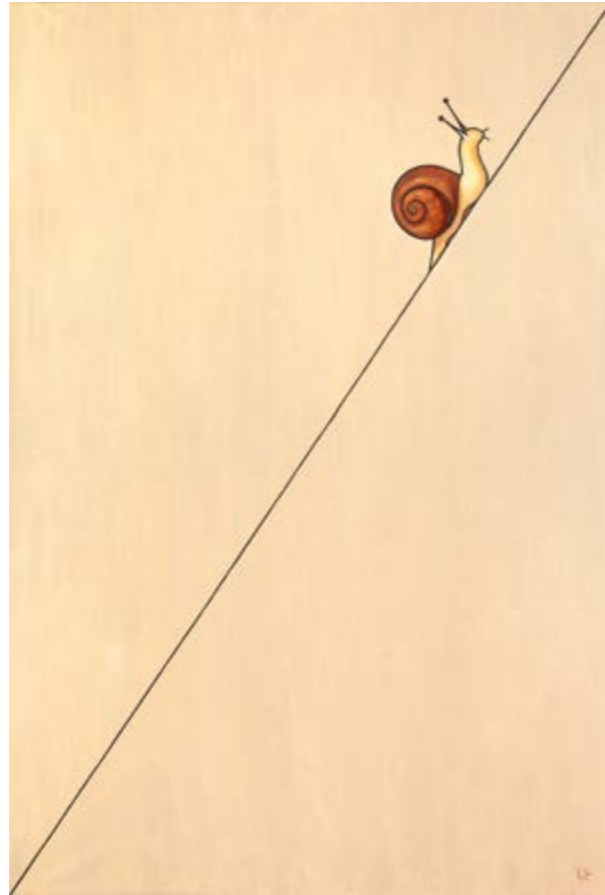
No importa (Oli sobre tela, 195x130 cm.)