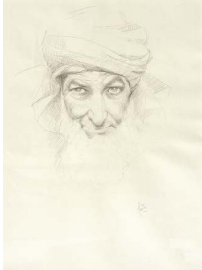
Primer esborrany de l'obra Hassan