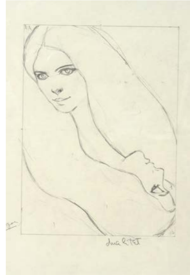
Primer esborrany de l'obra Dualitat