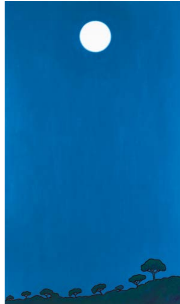
Dichoso el árbol (Oli sobre tela, 162x97cm.)

Les fulles mortes es recullen amb pala. Veus, jo no ho he oblidat. Les fulles mortes es recullen amb pala i els records i les recances també.