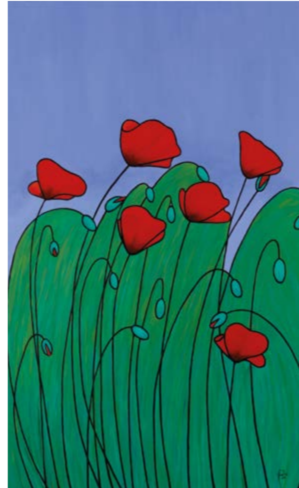
Recordes? (Oli sobre tela, 146x90 cm.)

El jardí i la tarda tranquil·la! Son l'aigua a la font de marbre.