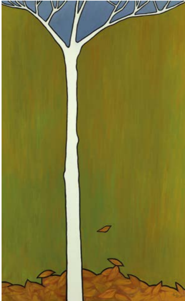
Records i recances (Oli sobre tela, 130x81cm.)