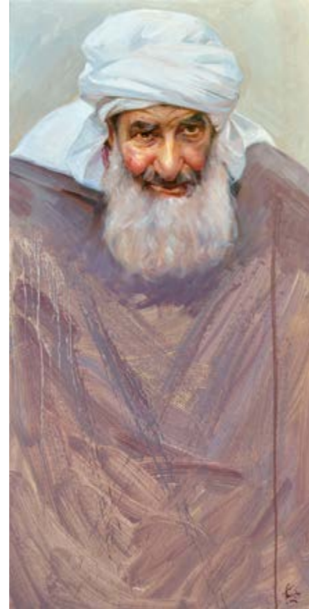
Hassan (Oli sobre tela, 100x50 cm.)