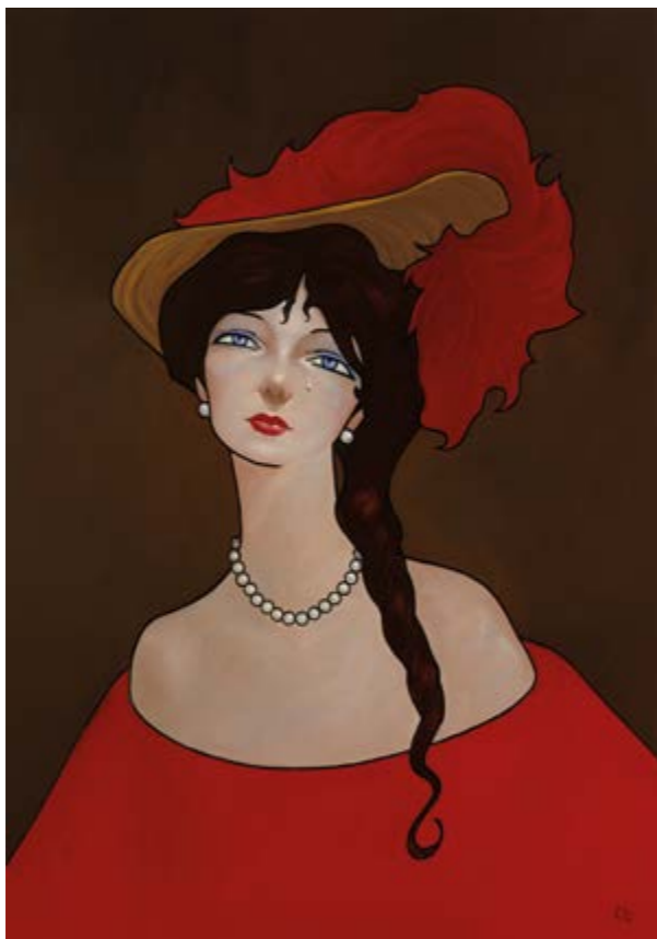
Jo no sé ni com se diu (Oli sobre tela, 162x114 cm.)

Josep Carner Barcelona, 1884 Brussel·les (Bèlgica), 1970