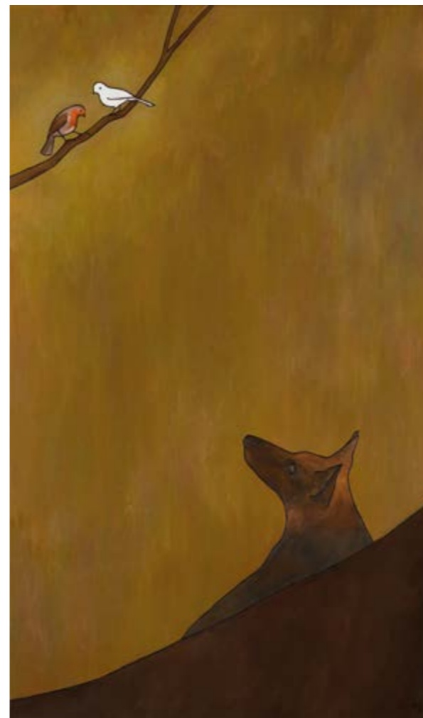
Dolces trivialitats (Oli sobre tela, 162x97 cm.)