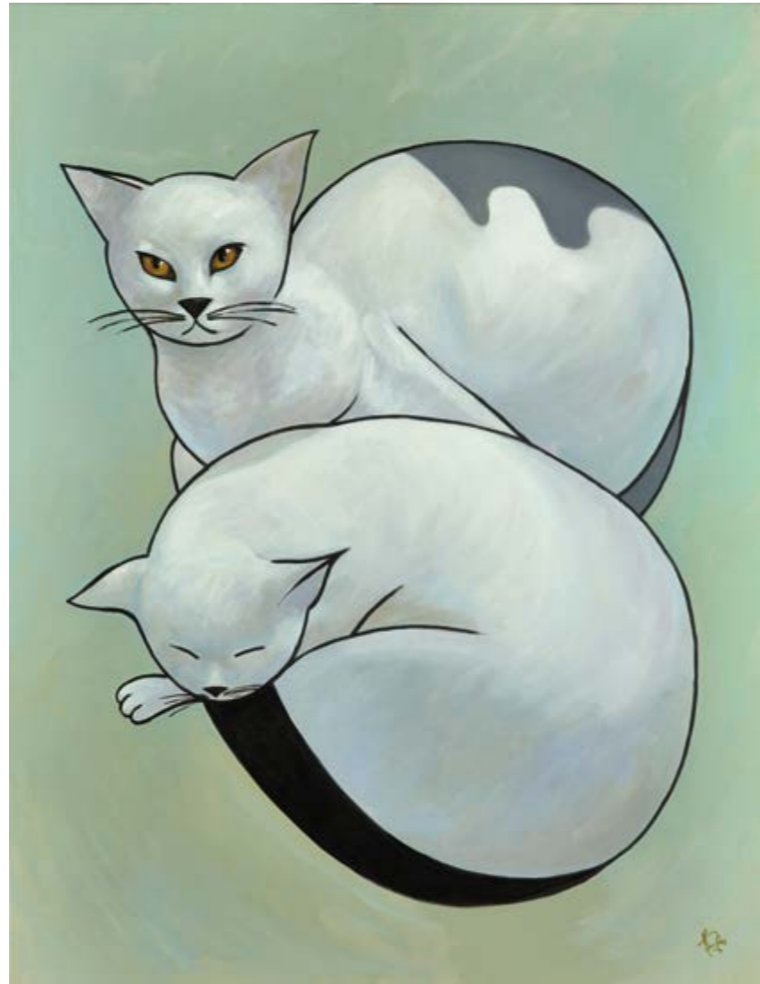
Discreció assegurada (Oli sobre tela, 116x89 cm.)