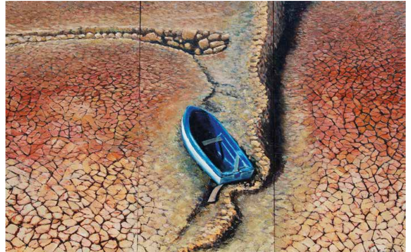
Era un lago Óleo sobre madera, 3 (60x30)