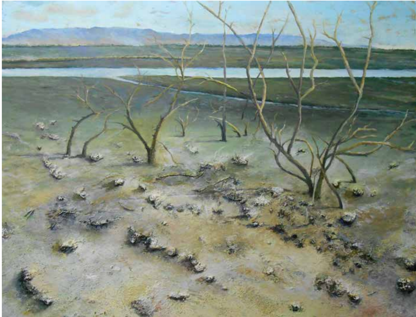
Back Mixta óleo sobre tela, 89x116