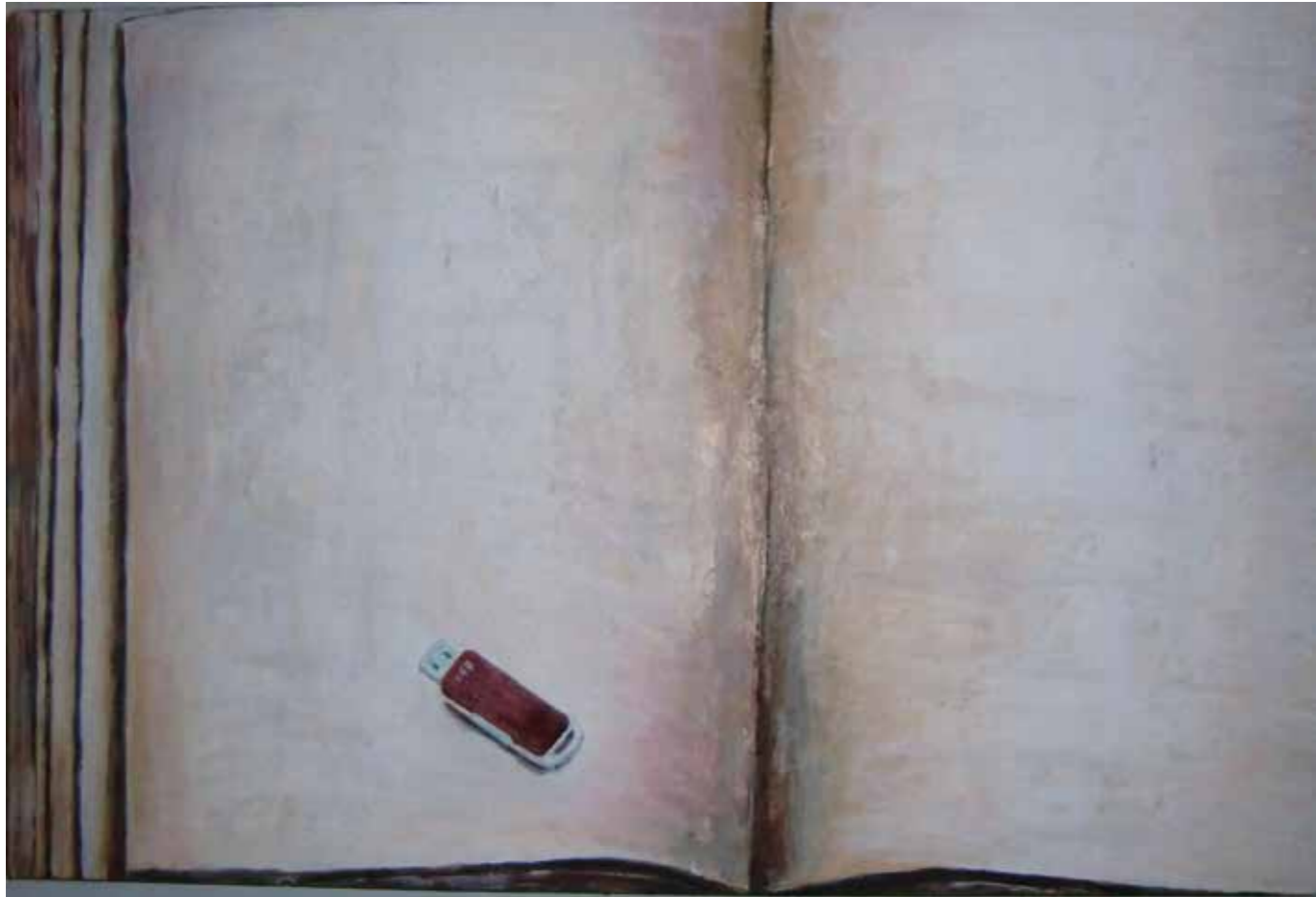
El Pen Drive que se comió las letras Óleo sobre madera, 30x60