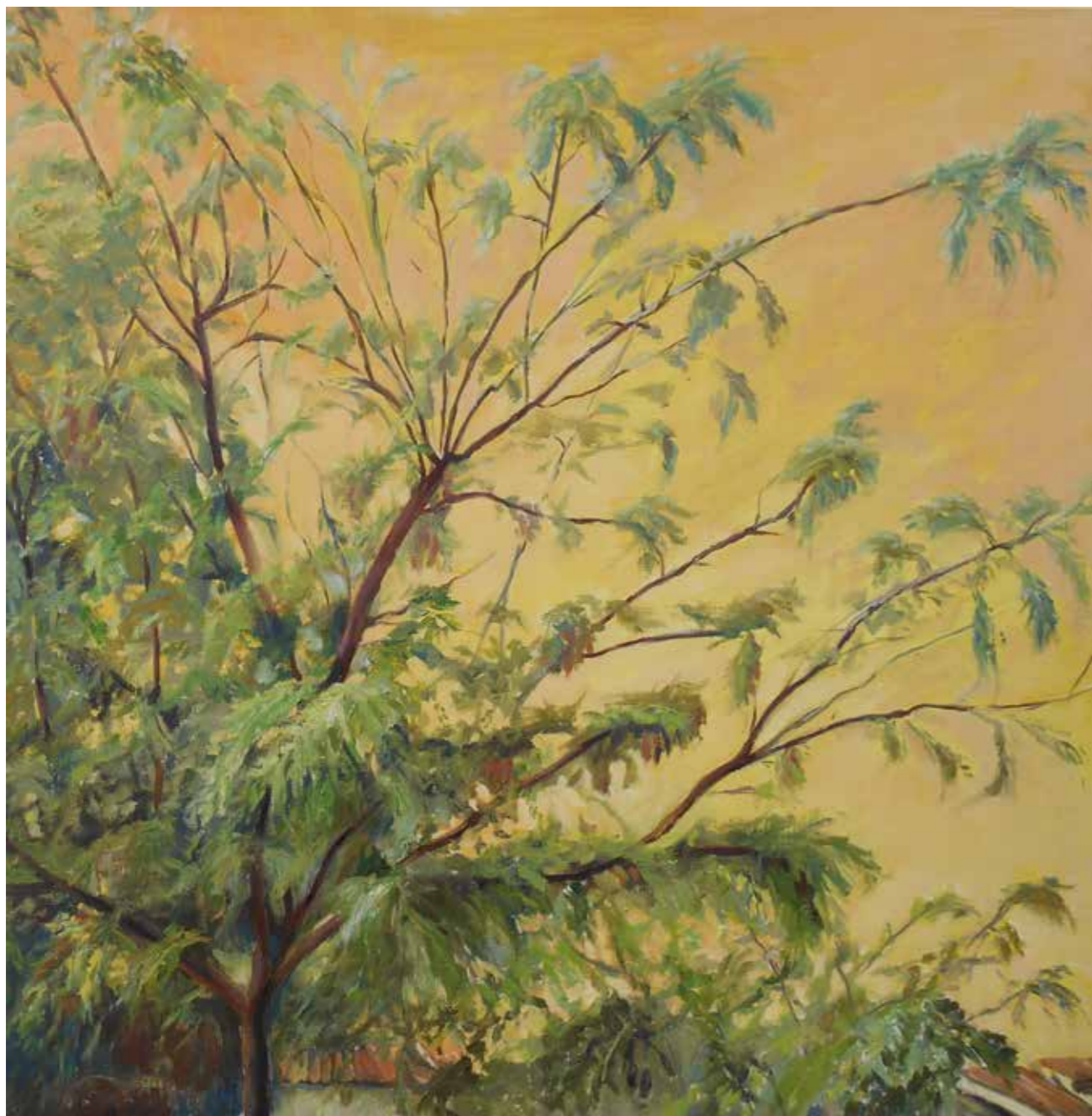
Chupones Óleo sobre tela, 60x60