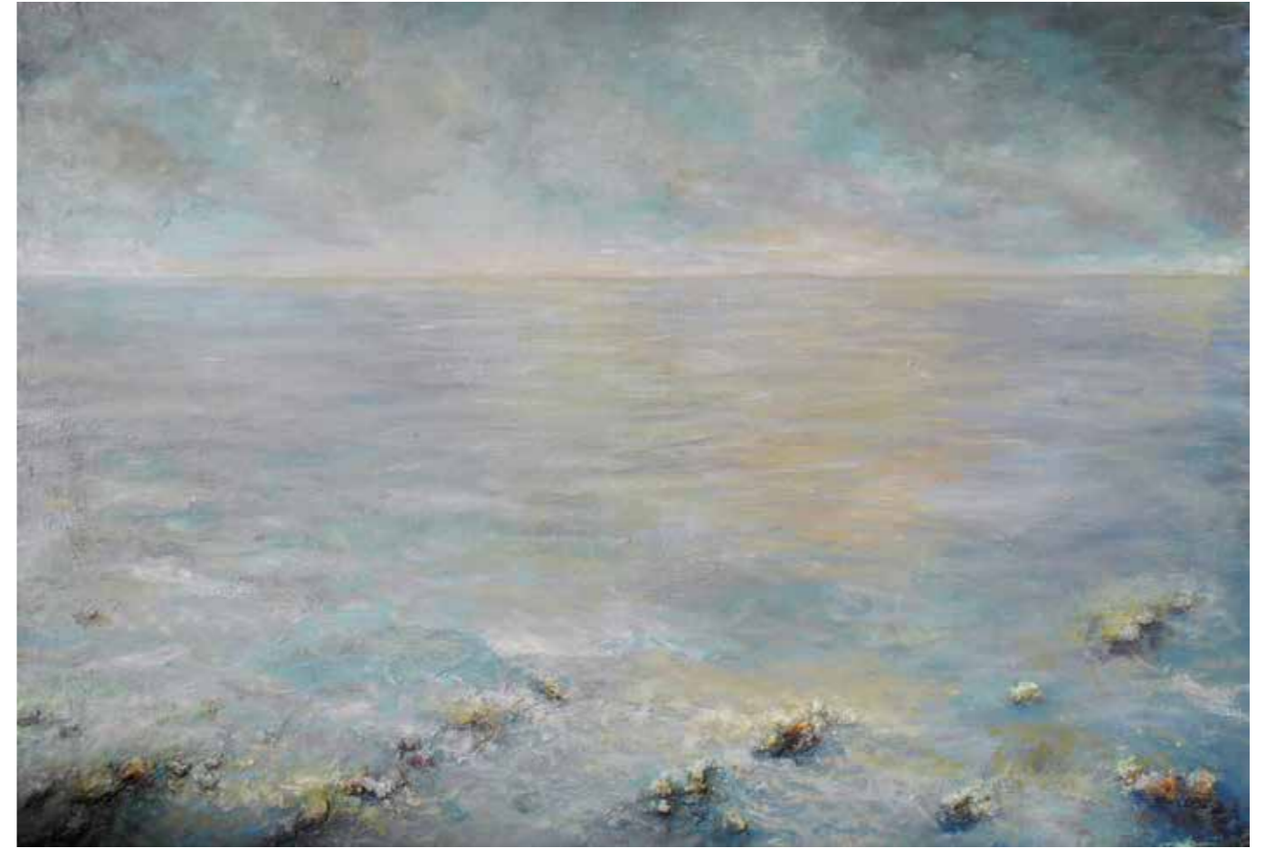
Light sea Óleo sobre tela 81 x 116