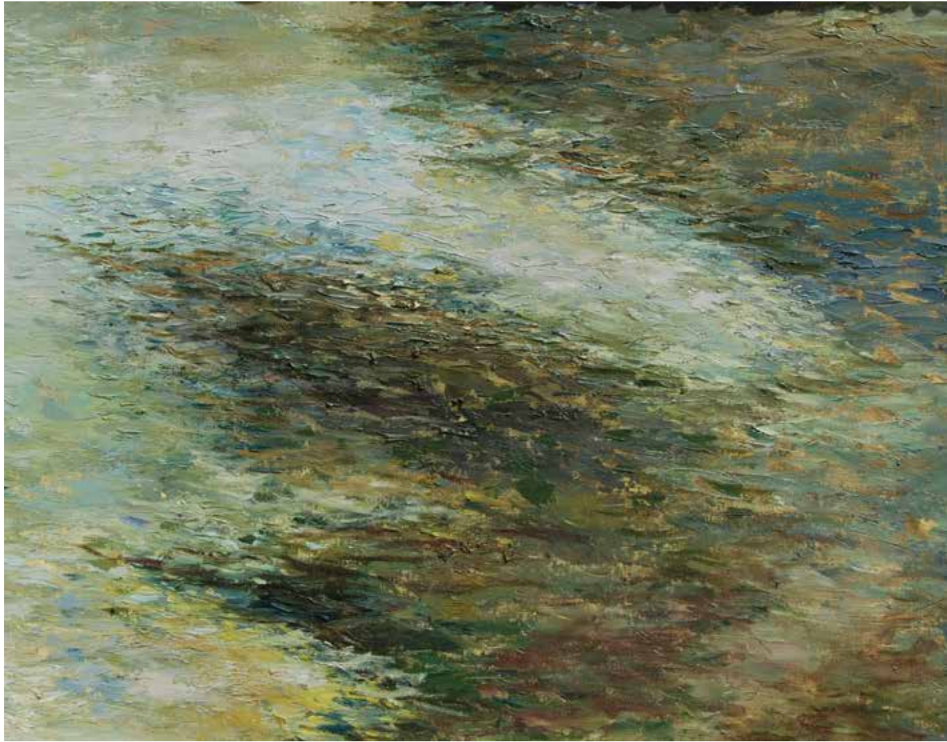
Reflejos Óleo sobre madera, 45 x 55